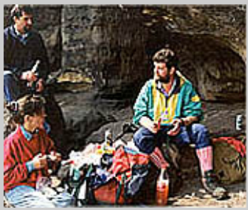
Wenn der kleine Hunger kommt...